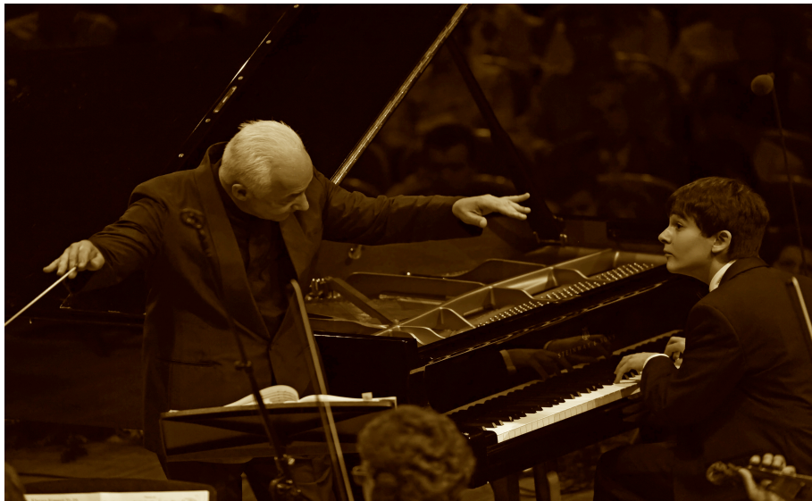
Ingmar Lazar, Vladimir Spivakov et les Virtuoses de Moscou